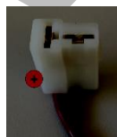
Boîtier de connecteur mâle